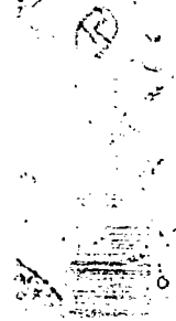
صورة عن الورقة الأخيرة من الجزء الأول من نسخة (ن).

من الذواذ والذواذ العتيق ورسول الله ما قام من حمدت بعدد من تحتها والاسم عشر عشرة من هذا ما جرت والاسم عشر عشرة من هذا ما جرت والاسم عشر عشرة من هذا ما جرت والاسم عشر عشرة من هذا ما جرت والاسم عشر عشرة من هذا ما جرت والاسم عشر عشرة من هذا ما جرت والاسم عشر عشرة من هذا ما جرت والاسم عشر عشرة من هذا ما جرت والاسم عشر عشرة من هذا ما جرت والاسم عشر عشرة من هذا ما جرت والاسم عشر عشرة من هذا ما جرت