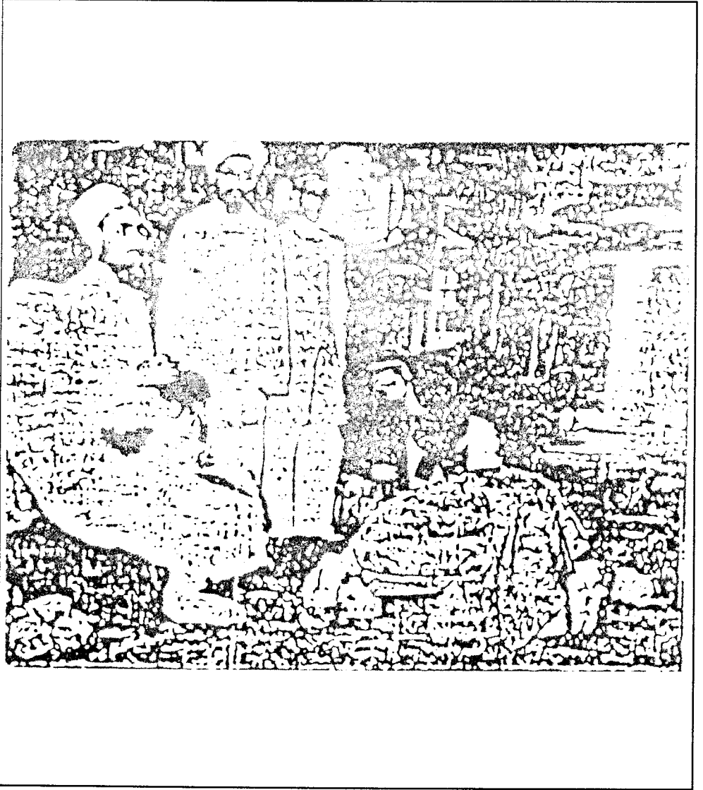
أحد أتباع البهرة يسجد لزعيمهم